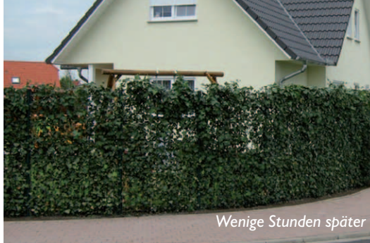
Wenige Stunden später